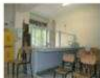
Laboratorio di scienze