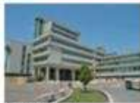
PCTO in Tribunale

SCUOLA INCLUSIVA ATTRAVERSO PROGETTI E ATTIVITÀ EDUCATIVE DIDATTICHE CON FINALITÀ INCLUSIVE. PERSEGUIAMO L'OBIETTIVO DI VALORIZZARE LE POTENZIALITÀ INDIVIDUALI MIGLIORARE L'AUTONOMIA E SOSTENERE LA CRESCITA EMOTIVO-RELAZIONALE DI CIASCUN ALUNNO.